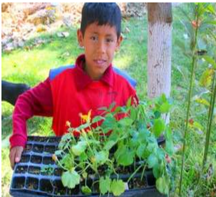
The Seed Program

The Mariposa Project is designed specifically for the physical, cognitive, social and emotional needs of children living and the staff working in a residential facility. The aptitudes taught and the programs designed in the Mariposa Project offer building life skills necessary for becoming a healthy, productive adult.